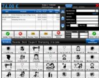
Logiciel de caisse « Front-office »